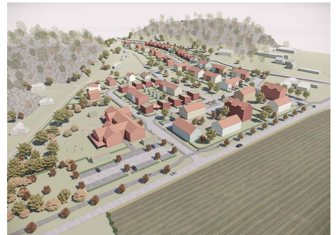
ILLUSTRATION 3D VY

Illustrationen ovan baseras på Illustrationskartan. Mindre avvikelser kan förekomma.