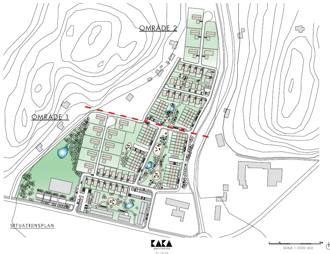
Figur 3. Planförslag för området (2021-10-25).

I december 2017 gavs ett positivt planbesked för del av fastigheten Näs 1:302 i Ödsmål för att möjliggöra nya bostäder samt förskola. Behovet av en ny kommunal förskola i Ödsmål uppmärksammades och del av fastigheten Näs 1:302 skulle kunna nyttjas för detta ändamål. Detaljplanen möjliggör förskola med åtta avdelningar samt ca 100 boenden i varierad form (Figur 3).