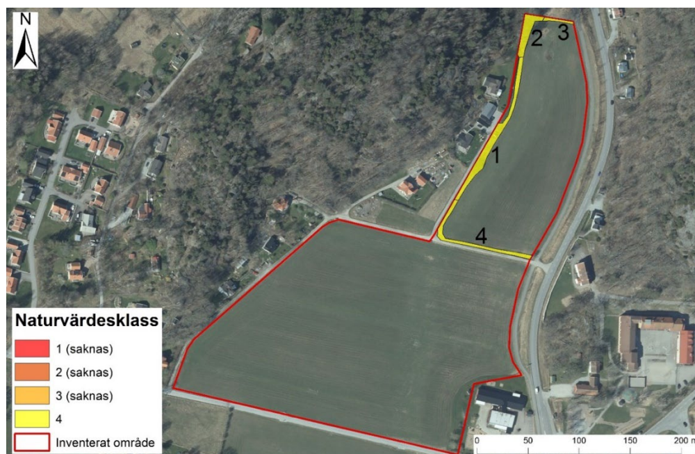
Figur 4. Planområdet där den naturvärdesinventering som utfördes 2021 är avgränsad med röd linje. Naturvärdesobjekt med visst naturvärde (klass 4) indikeras med gult. Naturvärdesobjekt med påtagligt (klass 3), högt (klass 2) och högsta (klass 1) naturvärde saknas

Naturmiljön finns beskriven i ett naturvärdesutlåtande som togs fram i december 2021 (Svensk Naturförvaltning AB, 2021). Den största arealen inom inventeringsområdet har lågt naturvärde och utgörs av åkermark med vallodling där fältskiktet domineras av bredbladiga gräs (Figur 4). Naturvärdesinventeringen kompletterades med fördjupade artinventeringar av groddjur och fåglar under våren 2022 (Svensk Naturförvaltning AB, 2022). Några groddjur påträffades inte i området och det dike som möjligen skulle kunna utgöra lekvatten bedömdes inte ha något större värde för eventuella groddjur i området. Under fågelinventeringen noterades 17 arter i området, samtliga representanter för några av de vanligast förekommande fågelarterna.