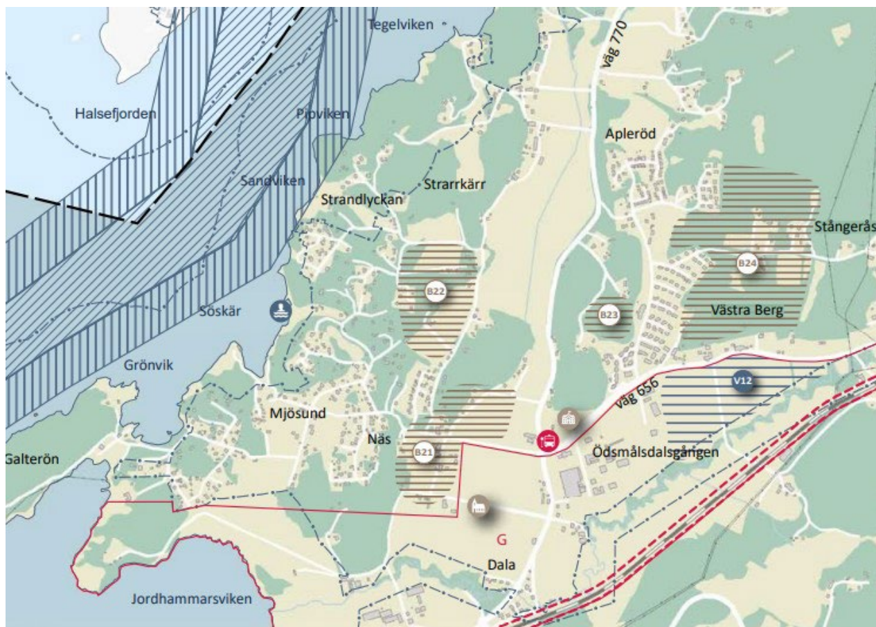
Figur 2. Utsnitt ur Översiktsplan 2020, planområdet omfattas delvis av den skrafferade ytan med markeringen B21.